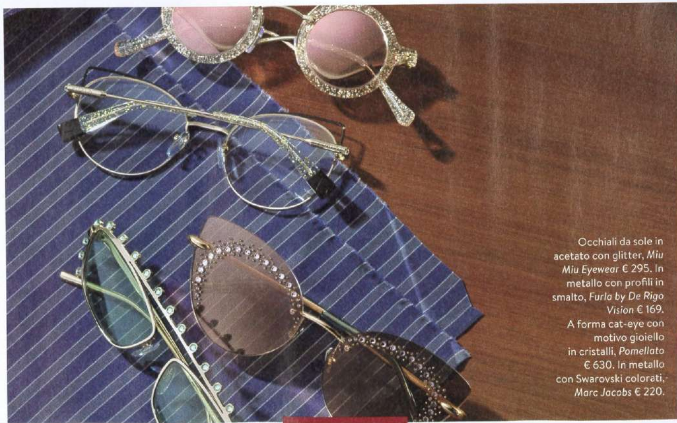
Styling Anna de Falco • Ha collaborato Maddalena Frazzingero

Occhiali da sole in acetato con glitter, Miu Miu Eyewear € 295. In metallo con profili in smalto, Furla by De Rigo Vision € 169. A forma cat-eye con motivo gioiello in cristalli, Pomellato € 630. In metallo con Swarovski colorati, Marc Jacobs € 220.