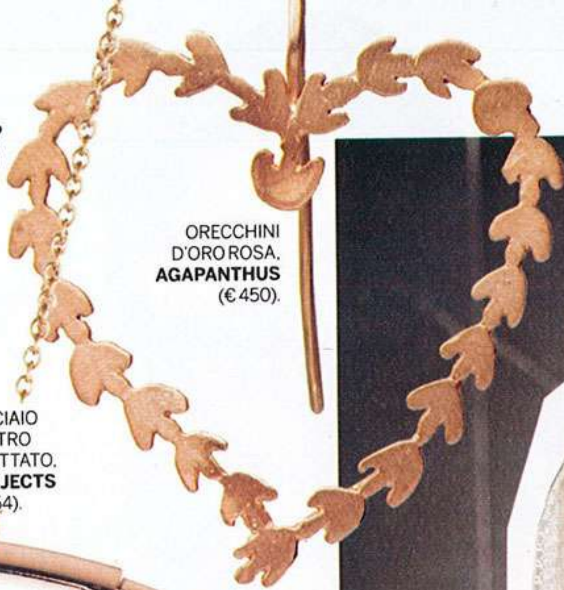
ORECCHINI D'ORO ROSA. AGAPANTHUS (€450).