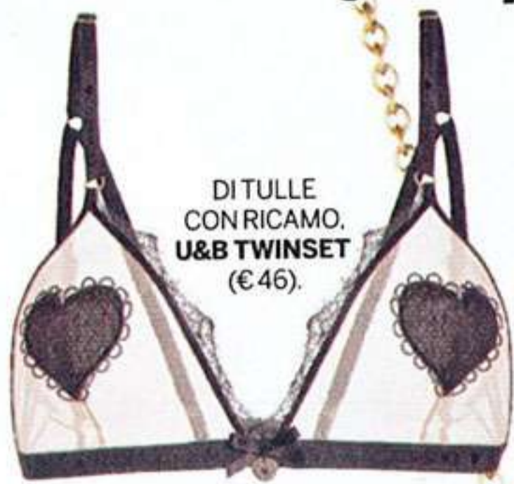
DITULLE CON RICAMO. U&B TWINSET (€46).