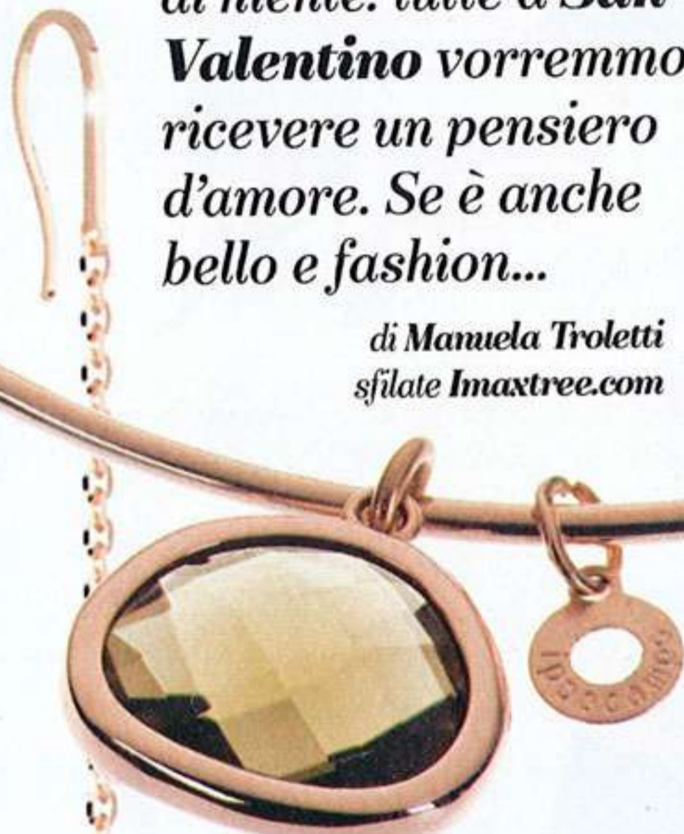
BRACCIALE DI GALVANICA ROSÉ E CRISTALLO. IPPOCAMPO (€29).

di Manuela Troletti sfilate Imaxtree.com