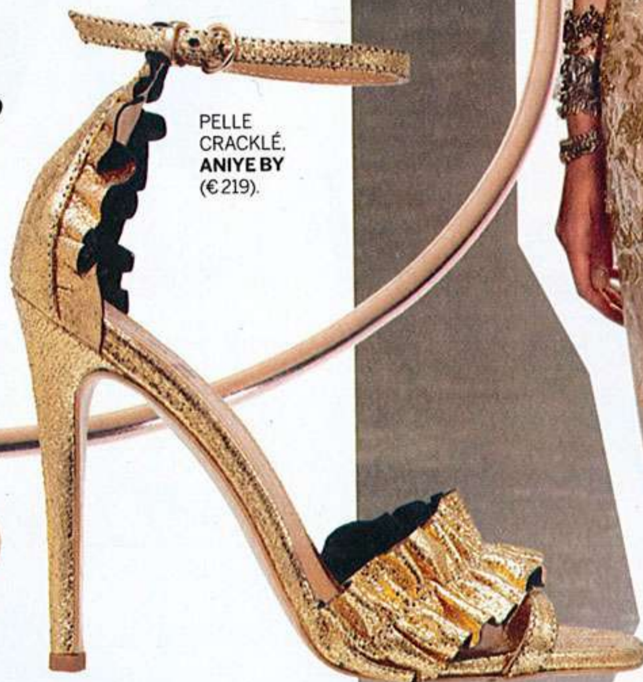
PELLE CRACKLÉ. ANIYE BY (€219).