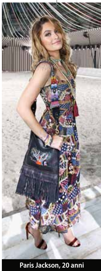
Paris Jackson, 20 anni

È il nuovo hippie, ma in una versione più romantica. Si a tanti gioielli piccoli e leggeri, da portare tutti assieme, impreziositi da simboli evocativi e cristalli